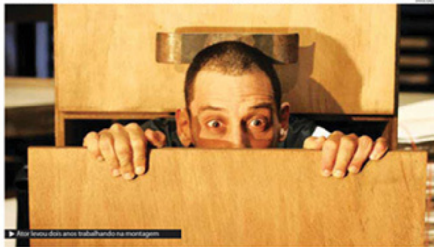
▶ Ator levou dois anos trabalhando na montagem