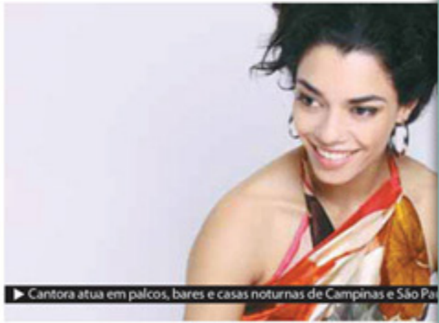
▶ Cantora atua em palcos, bares e casas noturnas de Campinas e São Paulo desde 2002

O DJ Barata segue depois do show com a discotecagem. O Almanaque fica na avenida Albino José Barbosa de Oliveira, 1240, em Barão Geraldo. Informações: www.almanaquecafe.com.br . METRO CAMPINAS