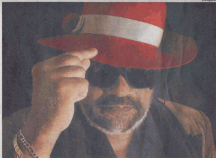
GERSON KING Combo, pioneiro da black music no Brasil, é atração na Casa São Jorge, em Barão Geraldo