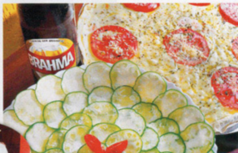
A pizza no palito acompanha bem uma loira gelada, mas, se a ideia for provar a especialidade da casa, vá de carpaccio de jiló

Apesar de o "terceiro turno" do expediente ser sua marca registrada, o Edu Pizza Bar abre às 16h e serve de paradeiro para quem procura as mais variadas propostas. Quer jantar? Peça o espetacular filé à parmegiana.