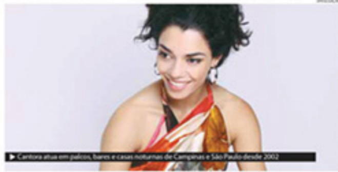
▶ Cantora atua em palcos, bares e casas noturnas de Campinas e São Paulo desde 2002

O DJ Barata segue depois do show com a discotecagem. O Almanaque fica na avenida Albino José Barbosa de Oliveira, 1240, em Barão Geraldo. Informações: www.almanaquecafe.com.br . METRO CAMPINAS